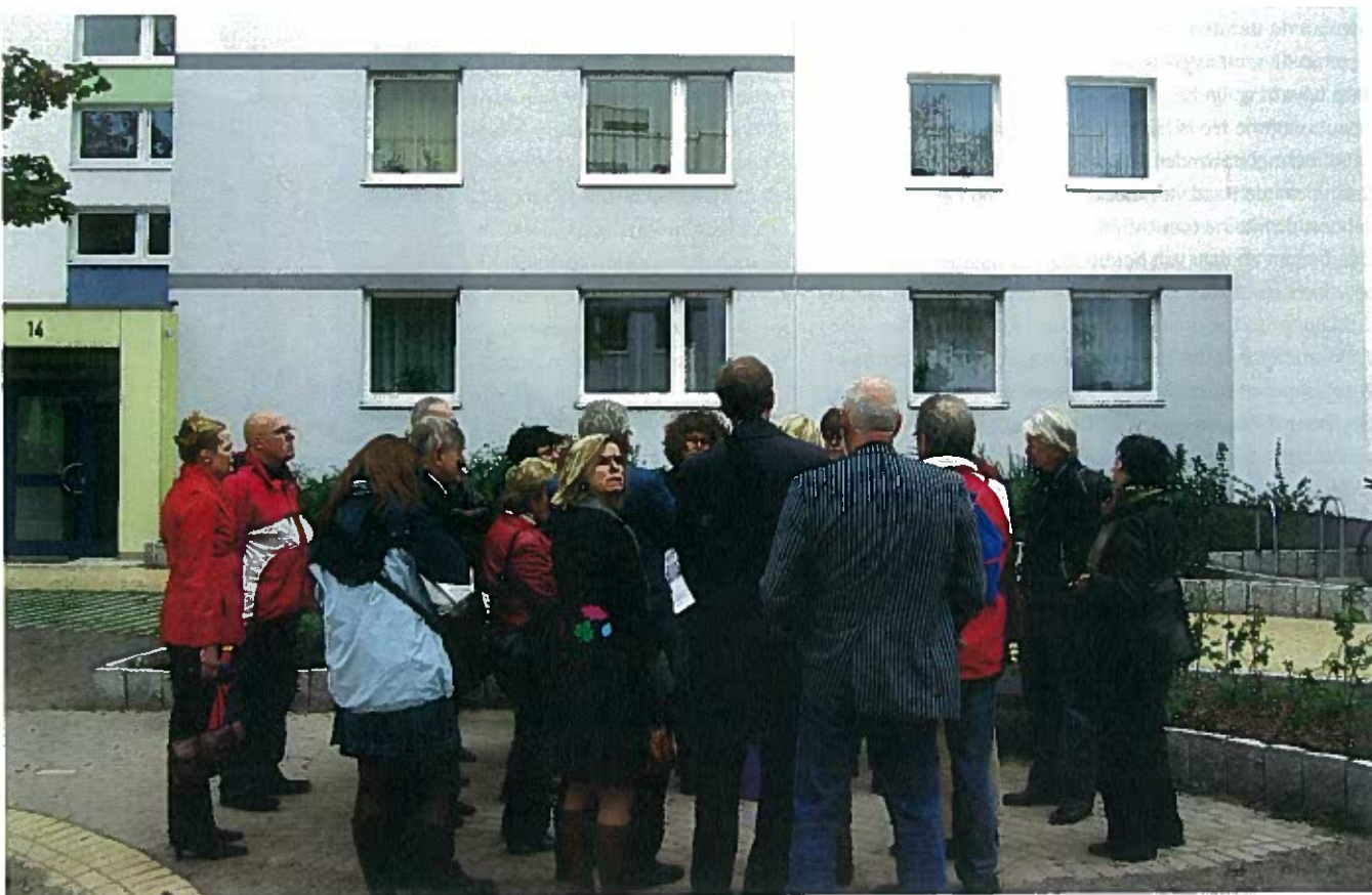
Visitatie: meer een instrument tot leren dan een instrument van toezicht

le en juridiserende oplossing gekozen voor veelal een beleidsmatig/politiek geschil van inzicht. Het wordt twijfelachtig of de Ondernemingskamer tot een bevredigende geschilbeslechting zal kunnen komen. Deze zal de beleidsmatige merites zeer marginaal toetsen. Het ligt meer voor de hand (eerst) een interne oplossing te zoeken door het inschakelen van de Raad van Toezicht. Ook is een beroep bij de Ondernemingskamer geen laagdrempelige voorziening. Dat alles zal de effectiviteit van deze procedure in de weg staan.